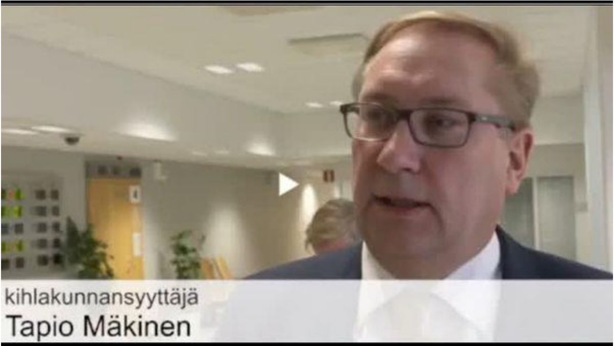
kihlakunnansyyttäjä Tapio Mäkinen